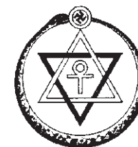
Im Siegel der Theosophischen Gesellschaft finden sich religiöse Symbole verschiedener Kulturen.