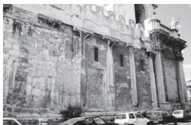
Die Kathedrale in Syrakus (4. Jhdt.): Man ummauerte einfach den alten griechischen Tempel. Noch heute sieht man dessen alte Säulen.

Richtig ist, dass im Zuge der christlichen Mission nicht selten an der Stelle alter heidnischer Heiligtümer oder Kultorte christliche Kirchen gebaut wurden. Manchmal wurden sogar die alten Heiligtümer einfach überbaut. Diese Praxis sollte es der einheimischen Bevölkerung leichter machen, die alten Kulte aufzugeben und das neue Christentum anzunehmen.