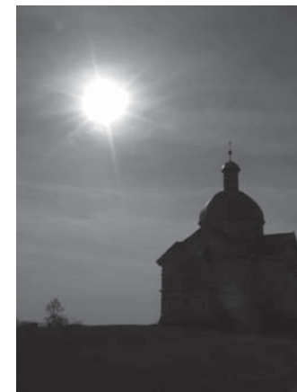
Die Kirchen mussten früher "orientiert" (=geostet) sein, denn vom Osten her erwartete man den wiederkommenden Christus.

geschichten oder Gründungslegenden zu studieren, die auch heute noch erklären, wo und warum eine Kirche erbaut oder eine Wallfahrtsstätte gegründet wurde. Nie ist die Rede von bestimmten Energiequalitäten, nie wird erzählt, dass Rutengänger die Plätze für den Kirchenbau gesucht hätten. Häufig sind dagegen Berichte über bestimmte Ereignisse, Erscheinungen, Auffindung von Bildern, besonderen Begegnungen, die einen Ort besonders auszeichneten und die zum Bau einer Kapelle oder Kirche geführt haben.